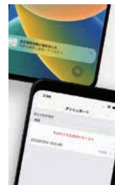
㈱ Laspy「あんしんストック防災アプリ」