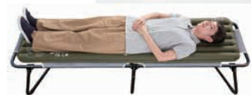
㈱イガラシ「ポンプインエアマットファミリー」